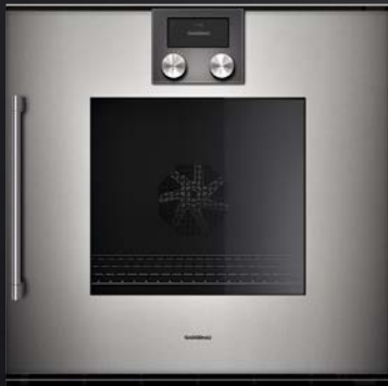
BOP 250/251 in Gaggenau Metallic