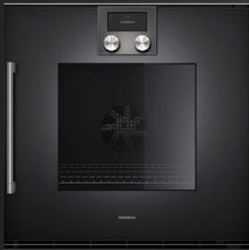
BOP 250/251 in Gaggenau Anthrazit