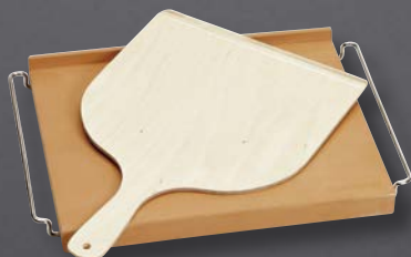
BA 056 133 Backstein, inkl. Backsteinträger und Pizzaschieber