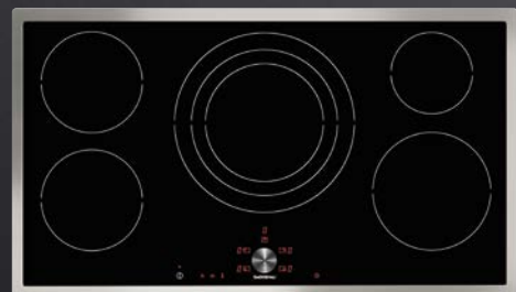
CI 491 113 Induktions-Kochfeld mit Edelstahlrahmen 90 cm breit