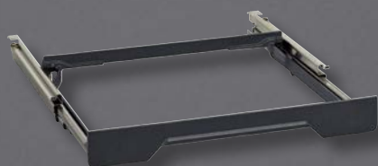
BA 016 103 Auszugssystem