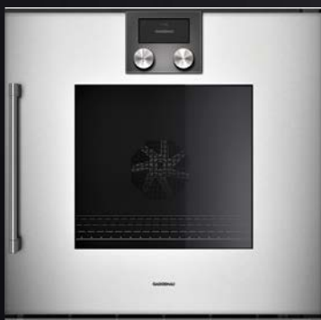
BOP 250/251 in Gaggenau Silber

Jedes Induktionskochfeld ab 80 cm Breite mit oder ohne Edelstahlrahmen, zum Beispiel: